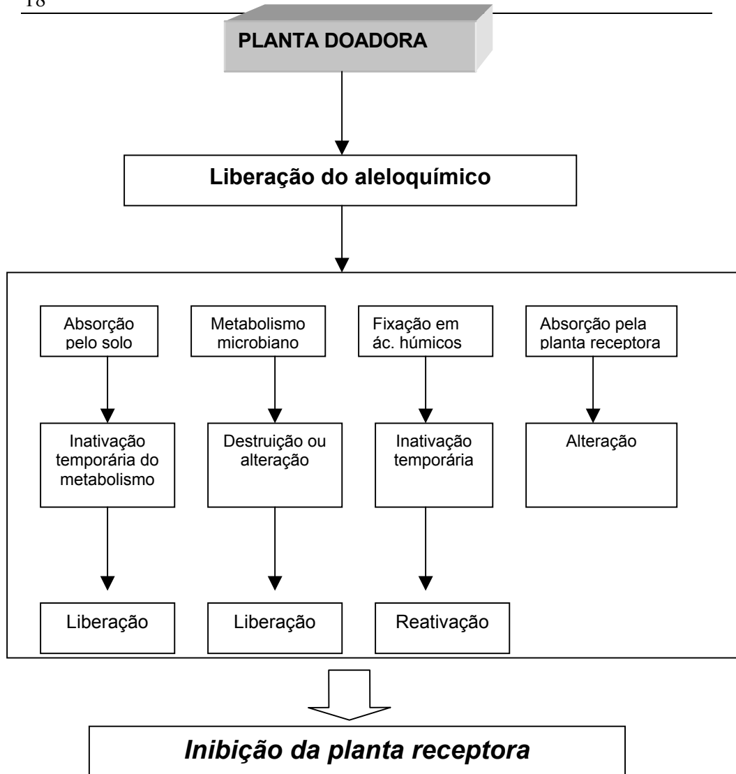
Figura 2 - Vias prováveis seguidas por compostos aleloquímicos da liberação pela planta doadora até causar o efeito alelopático na planta receptora.

Conforme se verifica na Figura 2, as interações que ocorrem são muito complexas, pois os produtos químicos presentes no meio podem vir